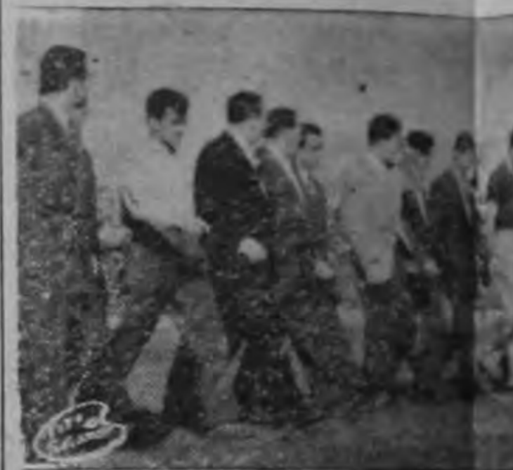
La delegación del Beogradzki in Estadio Nacional para salu

Por ahí comenzó la catástrofe, por la falta de arqueros que, poco a poco se fue extendiendo a todo el equipo, dando margen a que los visitantes se adueñaran del campo.