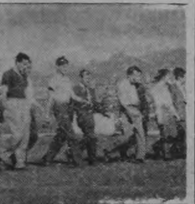
ingresa a la cancha del saludar a la afición.