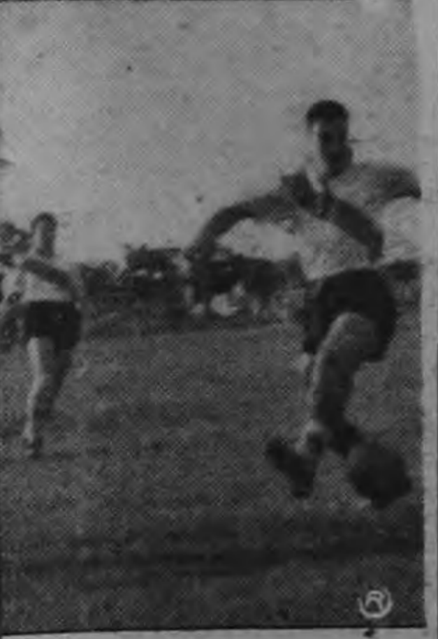
eciso aleja el peligro.