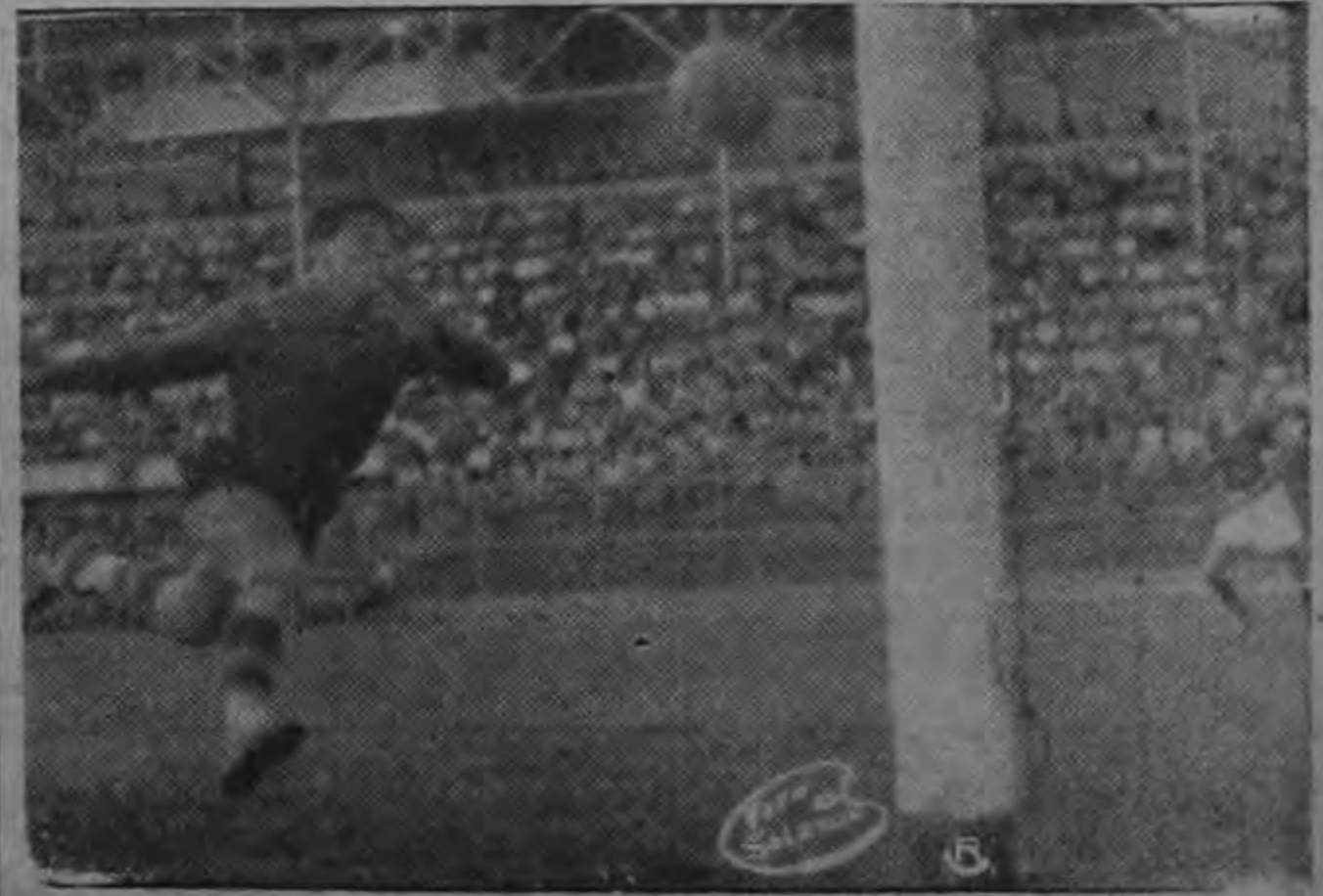
El arquero Campos del Herediano corre tras la pelota en un tiro desviado.