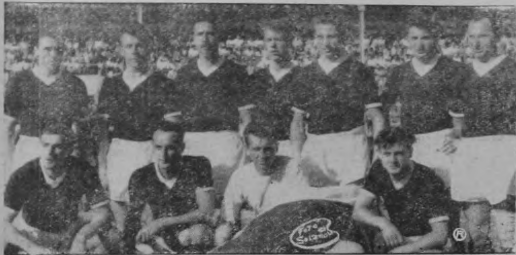
Wacker de Viena posa para los fotógrafos en la cancha del Estadio Nacional antes del encuentro con Herediano.