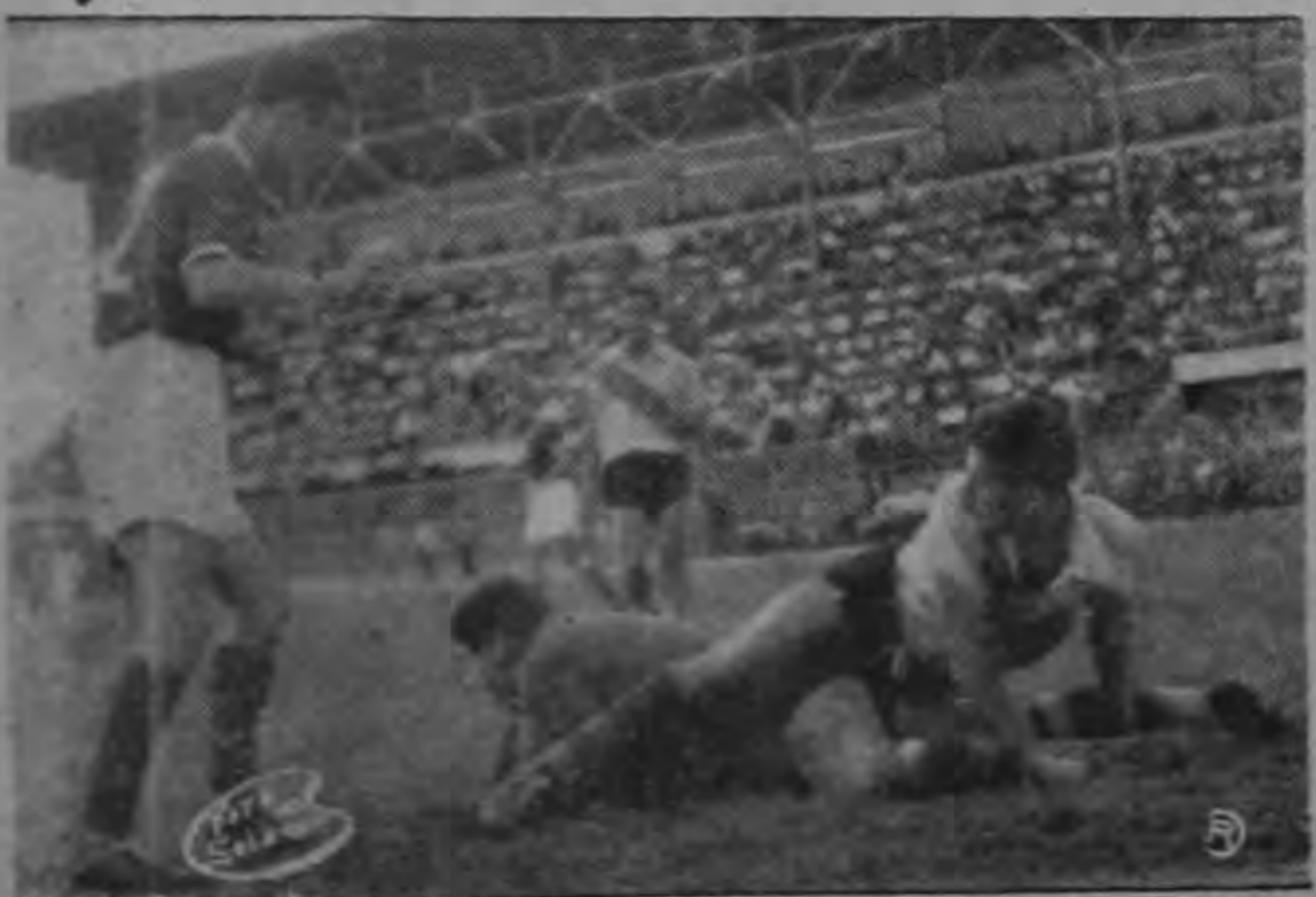
El arquero Campos y Nano Campos ruedan por el balón en un lance de apremio para la valla local.