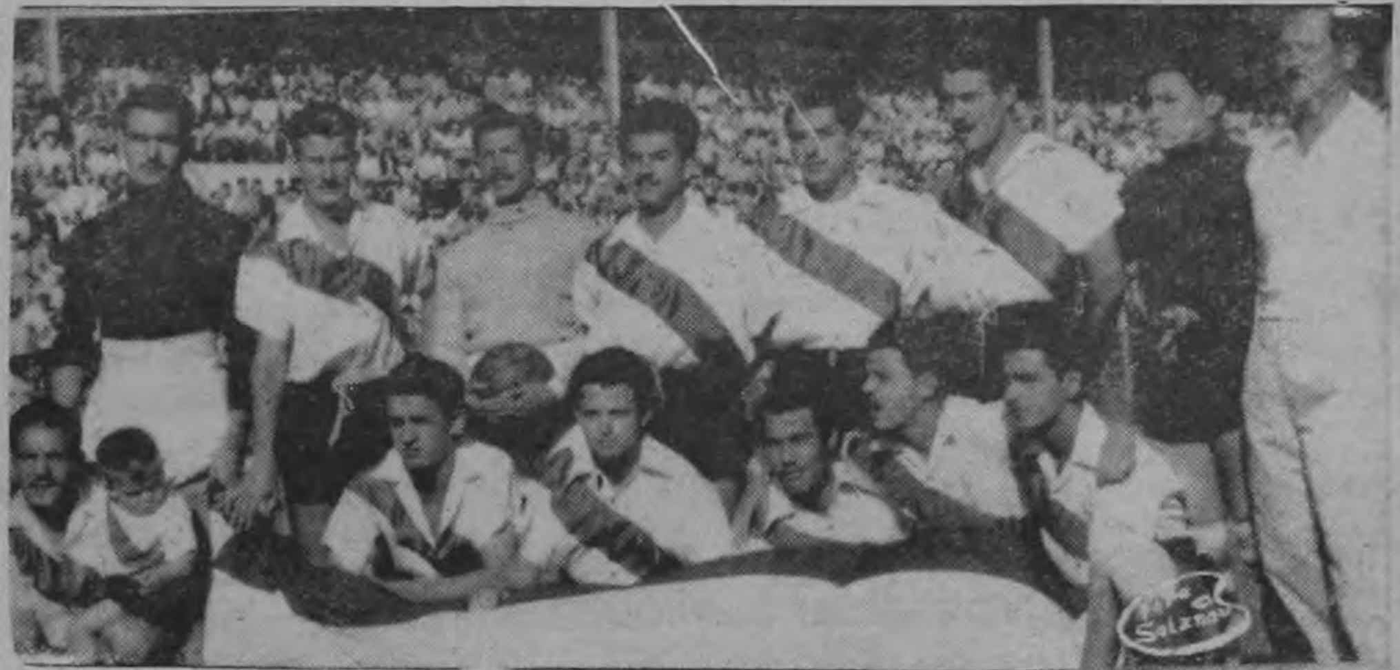
El conjunto del Herediano que se enfrentó el domingo al Wacker de Viena

Wacker: Pelikan, Steup, Kolman, Foreth, Kozltek, Ploderer, Kunbeck, Wagner, Smetana, Brouseck y Haunner.