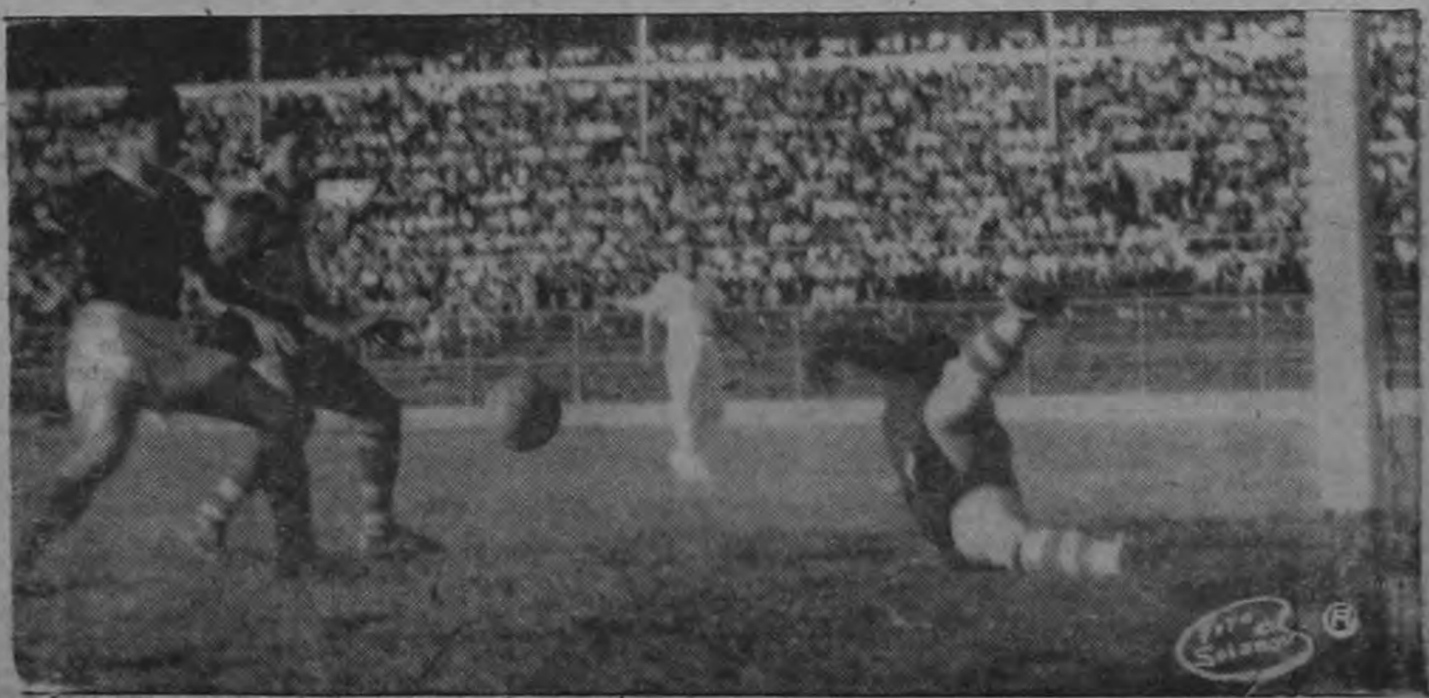
El arquero del Herediano en una estirada. La tarde era triste, los goles llovían...