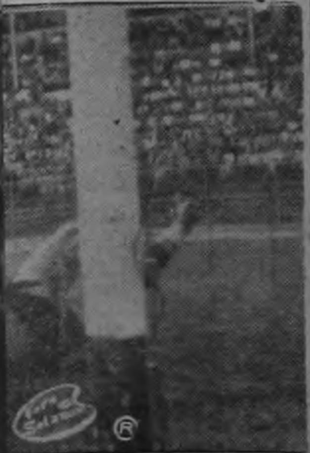
sobre la pelota para dete- visitantes.