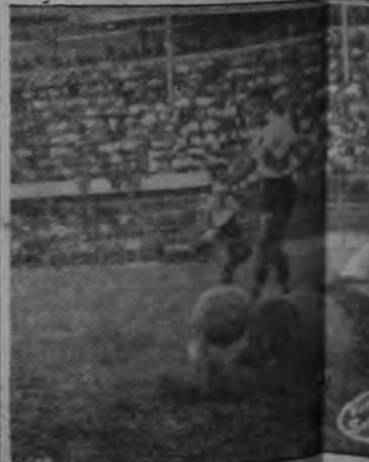
El arquero Campos se arroja sobre el balón para evitar un tiro de