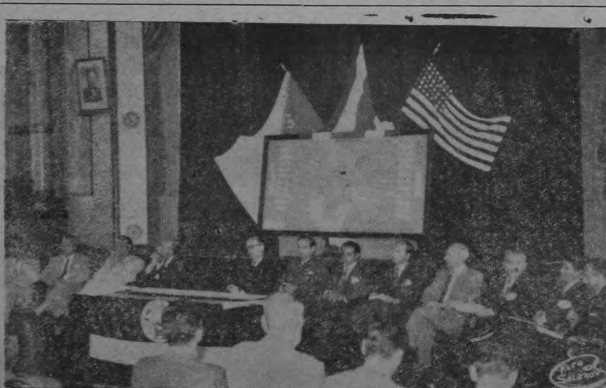
INAUGURACION VI CONVENCION DE EXTENSION AGRICOLA. — Desde ayer funciona en San José la VI Convención anual de Extensión Agrícola con asistencia de ilustres huéspedes de países americanos. El Presidente Figueres, Ministros y altas personalidades estuvieron presentes durante el acto inaugural.

En conversación telefónica con Washington que hizo el Sr. Ministro de Relaciones Exteriores con el Vice Ministro Lic. Fournier Acuña, éste último aclaró que no habían sido exactas las declaraciones que se le atribuyeron en un cable de la INS en que decía que — (Pasa a la Pág. CINCO) —